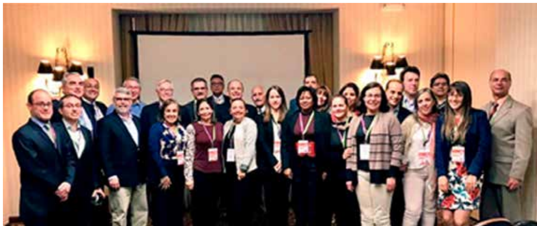
FOTO 1: Reunión presencial Consenso de Biosimilares. Lima, septiembre de 2017